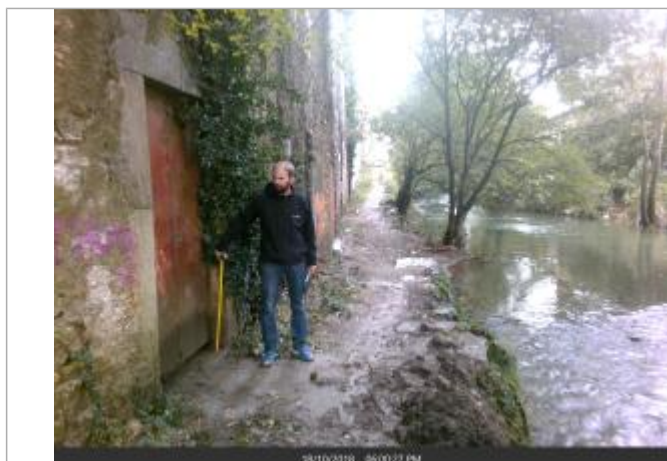
Porte en fer rouillée à coté du cours d'eau