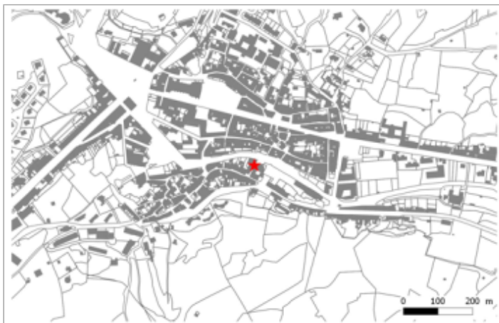
5 Rue du Pont Notre Dame