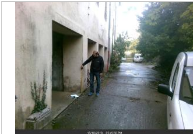
Angle droit du passage sous les maisons à l'aval du pont en bois