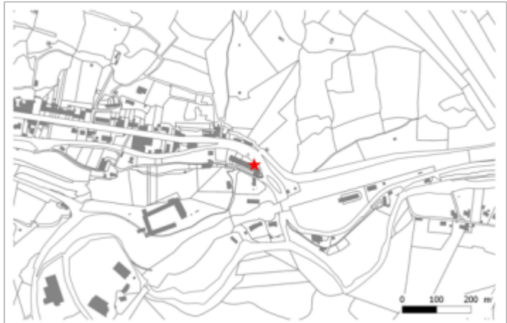
Avenue de la gare, En aval du pont en bois