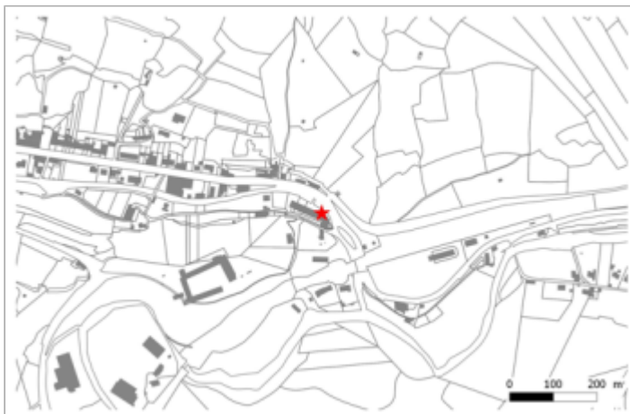
Avenue de la gare, En aval du pont en bois