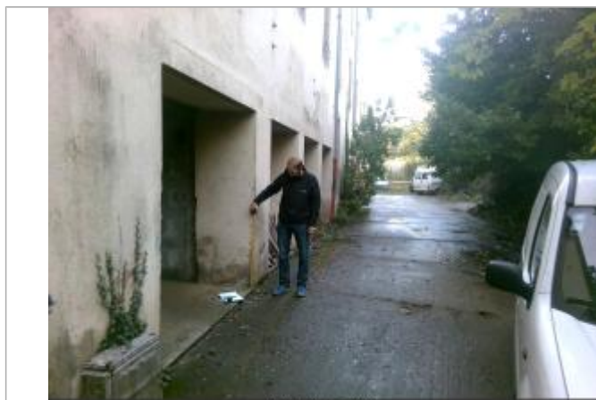
Angle droit du passage sous les maisons à l'aval du pont en bois