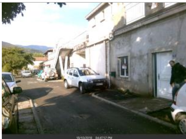
Porte d'entrée de la maison n°9 Rue Belle Ombre