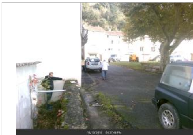
Muret au coin de la maison n°48 Place Foirail, du coté des toilettes publiques

Texte : Numero 1, Muret au coin de la maison n°48 Place Foirail, du coté des toilettes publiques Maximum de l'inondation : Oui Visibilité : Oui