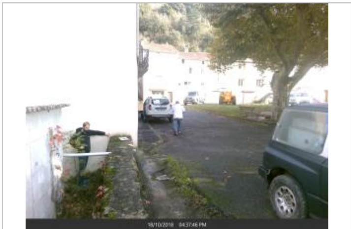
Muret au coin de la maison n°48 Place Foirail, du coté des toilettes publiques

MARQUE Texte : Numero 1, Muret au coin de la maison n°48 Place Foirail, du coté des toilettes publiques Maximum de l'inondation : Oui Visibilité : Oui