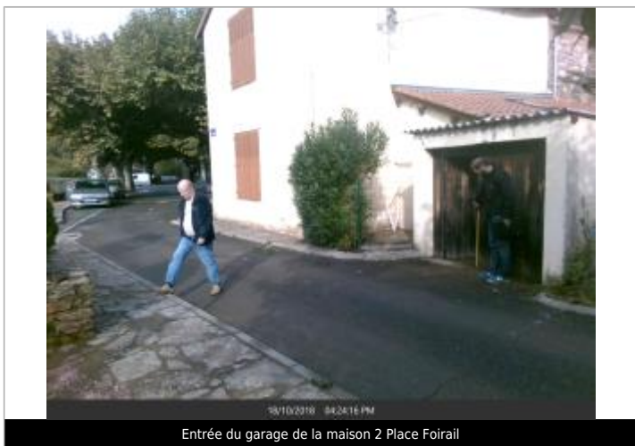
Entrée du garage de la maison 2 Place Foirail

Texte : Numero 2, Entrée du garage de la maison 2 Place Foirail Maximum de l'inondation : Oui Visibilité : Oui