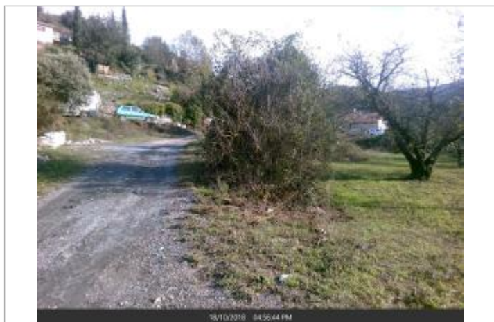
1er cerisier en entrant dans la propriété