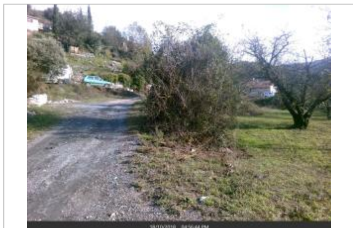
1er cerisier en entrant dans la propriété