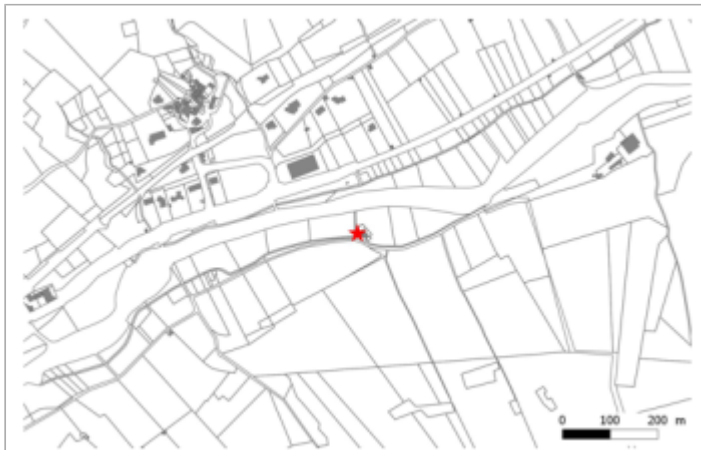
Chemin de la Roque, Pont des "Brettes"