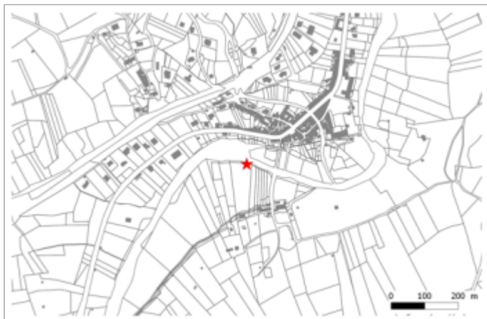
Stade municipal de Premian