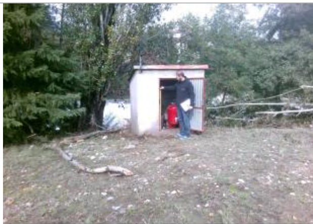
Cabane de la pompe à eau du stade