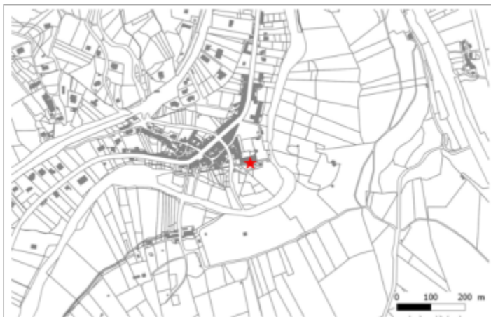
Ecole de Premian