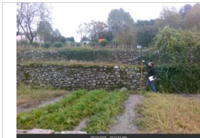
Mur de soutènement du jardin