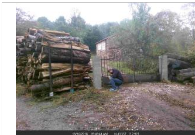
Portail de l'entrée de la scierie