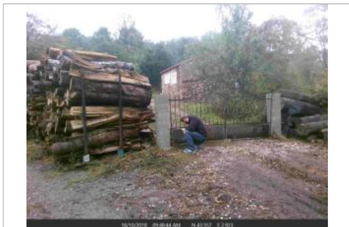
Portail de l'entrée de la scierie