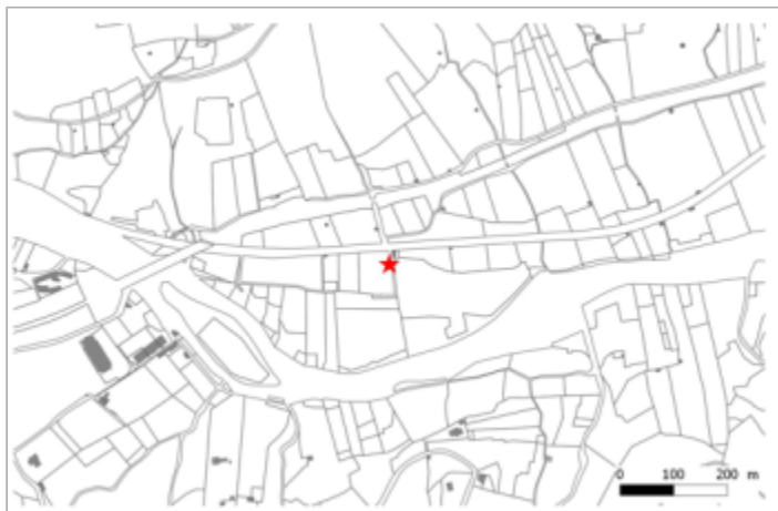
Scierie à les Madheilhan

Coordonnées WGS84 : X: 2.92337070 / Y: 43.55720100