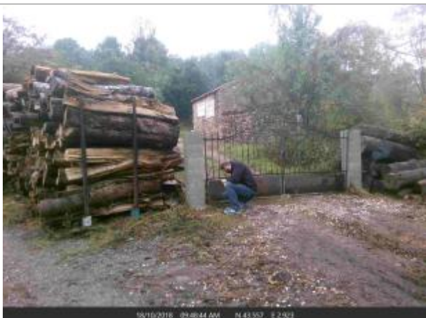
Portail de l'entrée de la scierie

Altitude calculée de l'eau (en m) : 163.55