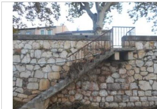
Escalier sur quai rive gauche, partie basse de la rue des Granières