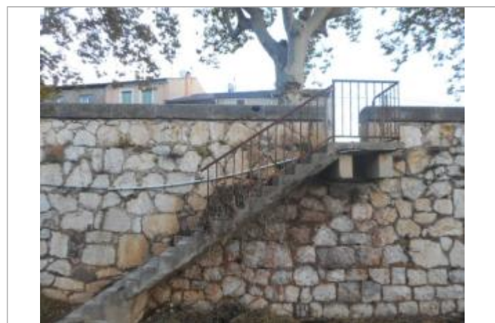
Escalier sur quai rive gauche, partie basse de la rue des Granières