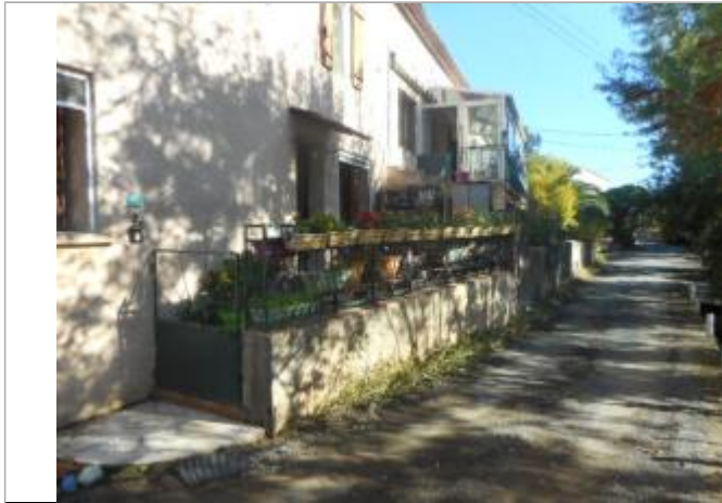
Terrasse devant la porte d'entrée de la maison n°20 Rue des jardins