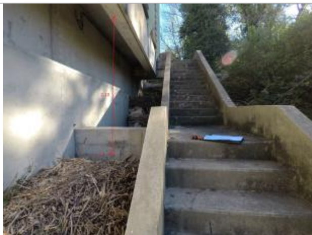
Au niveau de l'escalier (16ème marche à partir du haut)

Altitude calculée de l'eau (en m) : 40.05 m