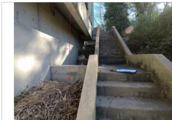
Au niveau de l'escalier (16ème marche à partir du haut)