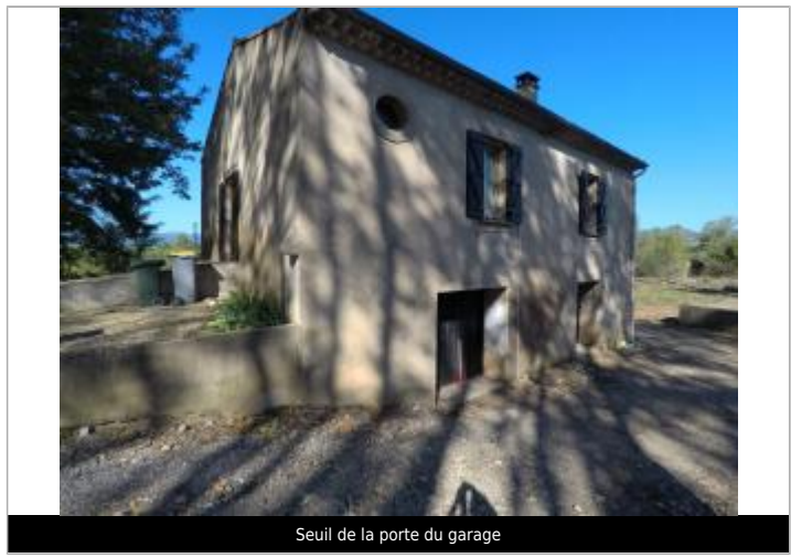
Seuil de la porte du garage