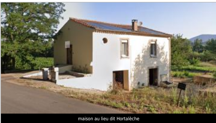
maison au lieu dit Hortalèche