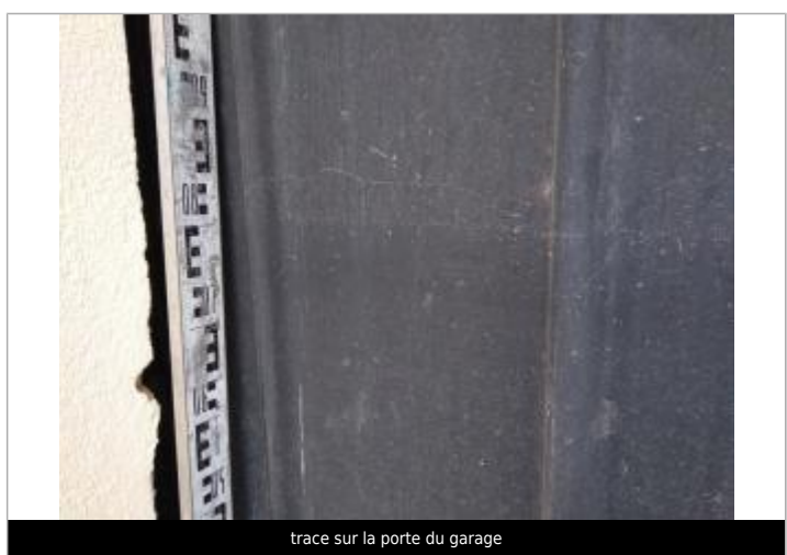
trace sur la porte du garage