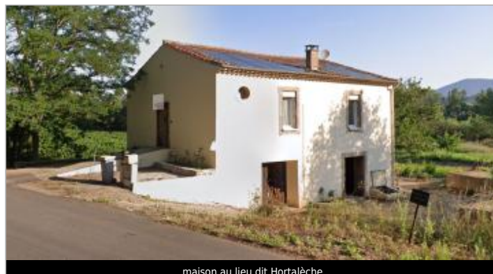
maison au lieu dit Hortalèche

GÉOLOCALISATION Coordonnées WGS84 : X: 3.04078010 / Y: 43.44926600 Coordonnées RGF93 (Lambert 93) X: 703302.43 / Y: 6261130.15 Coordonnées RGF93 (ETRS89) : X: 3.0407801 / Y: 43.449266 Code Hydro: Y25-0400 Rive de référence: