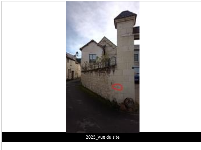
2025_Vue du site