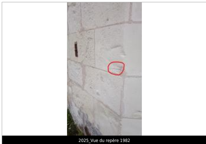
2025_Vue du repère 1982