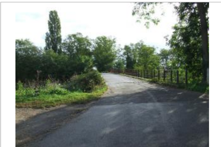
Vue général du site

GÉOLOCALISATION Coordonnées WGS84 : X: 7.40477060 / Y: 48.00397600 Coordonnées RGF93 (Lambert 93) X: 1028311 / Y: 6776224.99 Coordonnées RGF93 (ETRS89) : X: 7.4047706 / Y: 48.003976 Code Hydro: A---0030 Rive de référence: