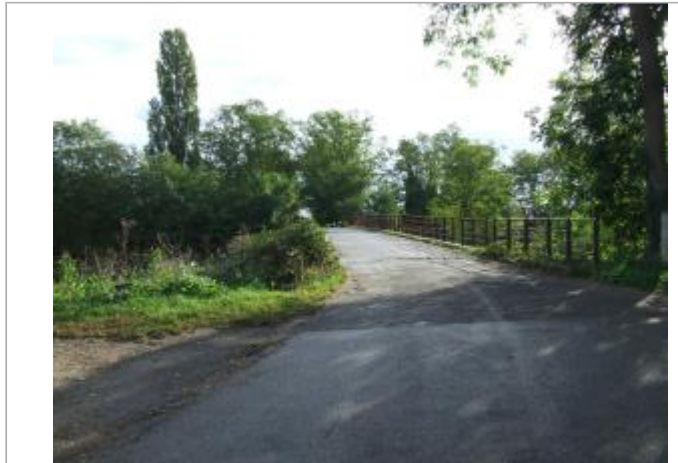
Vue général du site

Coordonnées WGS84 : X: 7.40477060 / Y: 48.00397600