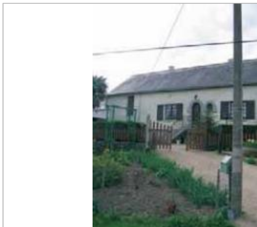
Grand Aireau nord