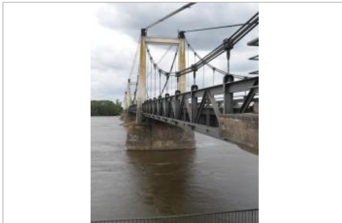
Pont de Montjean-sur-Loire