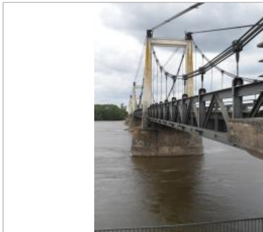
Pont de Montjean-sur-Loire