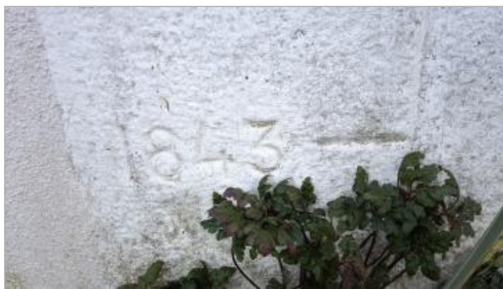
2025_Vue du repère