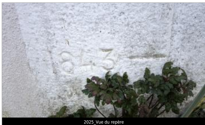
2025_Vue du repère