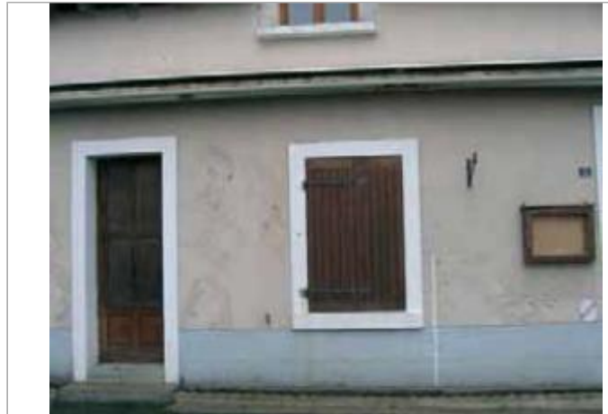
Place de l'Eglise BEHUARD