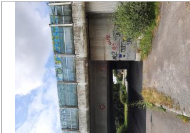
Vue sur le site

Coordonnées WGS84 : X: -1.47477040 / Y: 47.23352870