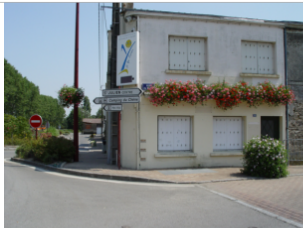
20 rue du Stade

Coordonnées WGS84 : X: -1.38633950 / Y: 47.25526030