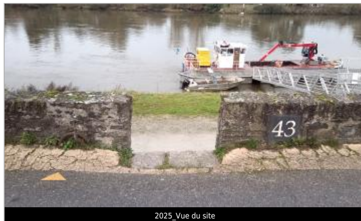
2025_Vue du site

GÉOLOCALISATION Coordonnées WGS84 : X: -1.39007110 / Y: 47.27887730 Coordonnées RGF93 (Lambert 93) : X: 368307 / Y: 6695730 Coordonnées RGF93 (ETRS89) : X: -1.3900711 / Y: 47.2788773 Code Hydro : ----0000 Rive de référence: Gauche