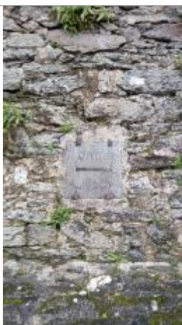
2025_Vue du repère