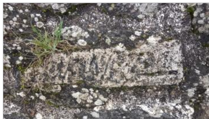
2025_Vue du repère

GÉNÉRAL Code : CORELA_R_7336_4 Date de mise à jour : 31/12/2025 Auteur : SPC MLA