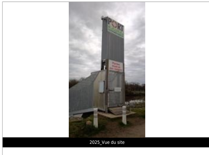
2025_Vue du site