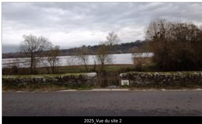
2025_Vue du site 2

Coordonnées WGS84 : X: -1.37144278 / Y: 47.28983030