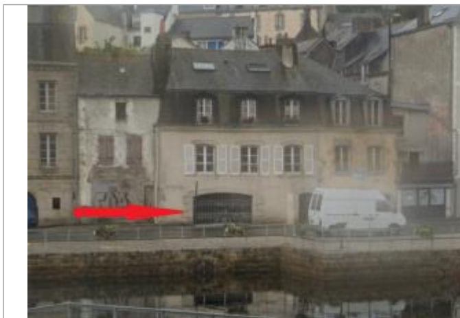
Bâtiment au 4 quai Brizeux, à gauche du pas porte commercial