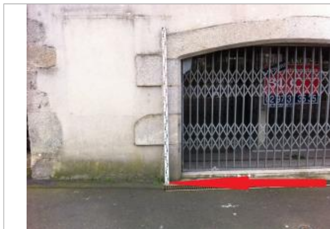
Trottoir à gauche de l'entrée du local commercial

Altitude calculée de l'eau (en m) : 4.91 m