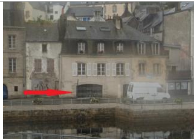
Bâtiment au 4 quai Brizeux, à gauche du pas porte commercial