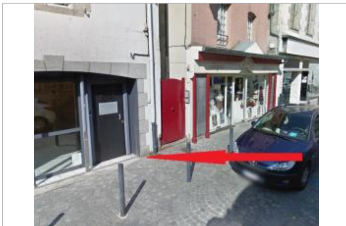
porte de dépôt express au 2 place Hervo