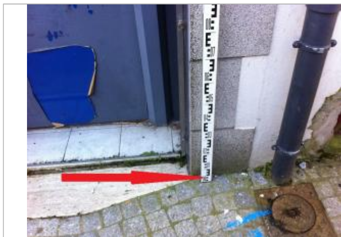
trottoir à l'angle droit de l'entrée de la porte à gauche de la gouttière (cf photographie)