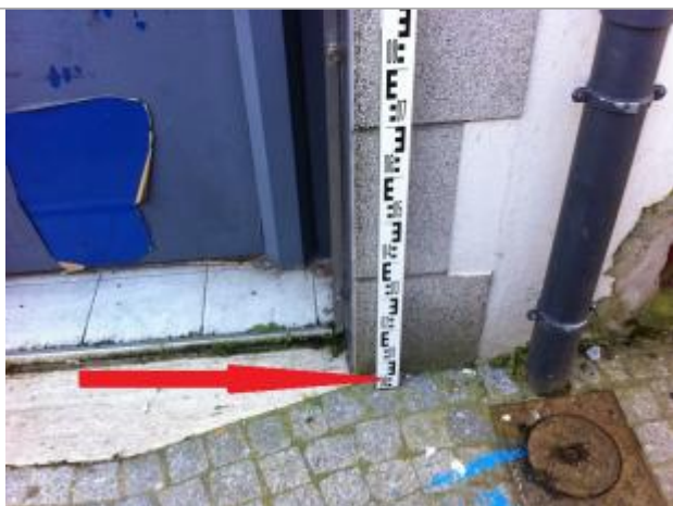
trottoir à l'angle droit de l'entrée de la porte à gauche de la gouttière (cf photographie)