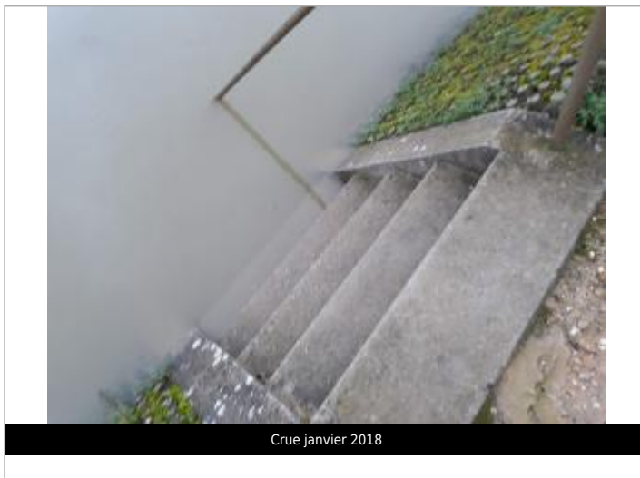
Crue janvier 2018