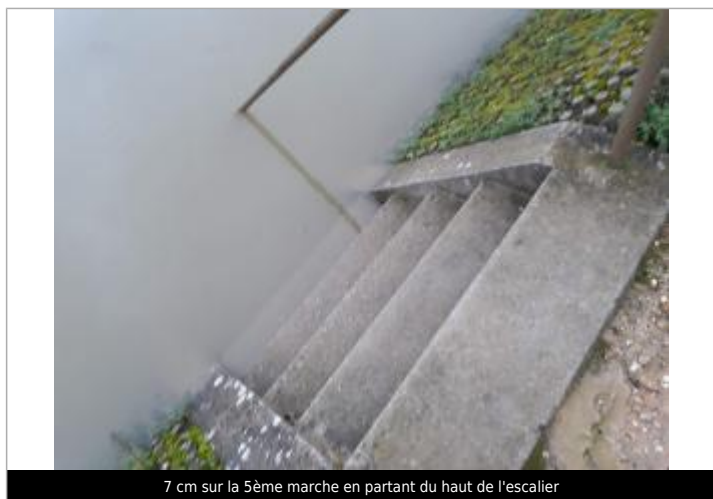
7 cm sur la 5ème marche en partant du haut de l'escalier

HAUTEUR D'EAU: +7 CM SUR LA 5ÈME MARCHE EN PARTANT DU HAUT DE L'ESCALIER - 30/01/2018