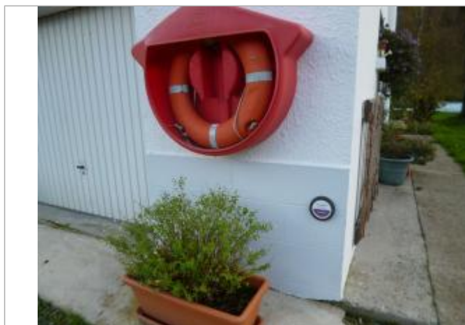
Pignon de la maison éclusière _ repère de crue

Altitude calculée de l'eau (en m) : 25.55 m