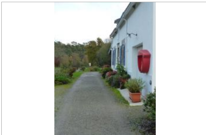
Vue générale du site (Auteur : SMSB)