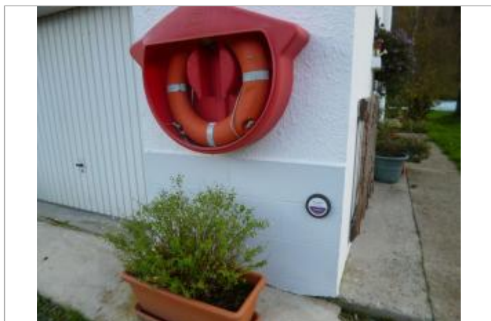
Pignon de la maison éclusière _ repère de crue

Code : RC_BLA_BAUD_1 Date de mise à jour : 10/03/2021