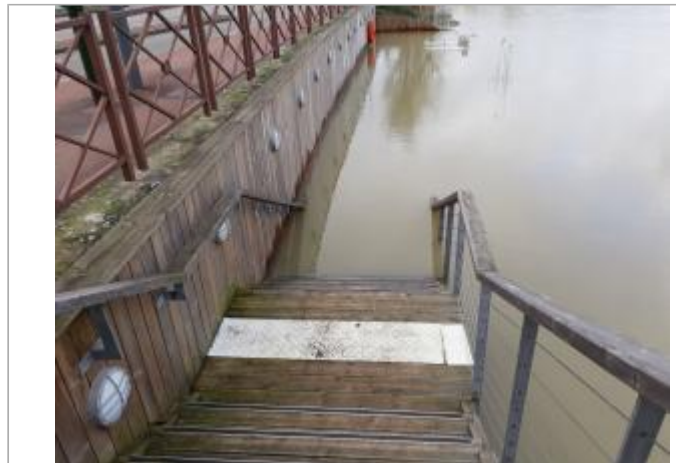
Crue de janvier 2018