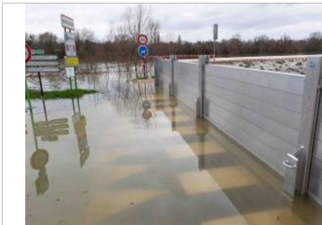
hauteur d'eau: +9 cm par rapport au pied du batardeau