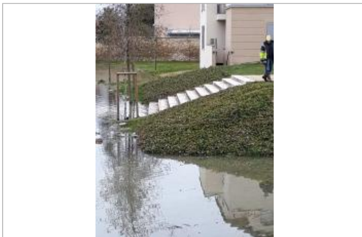
Crue de janvier 2018