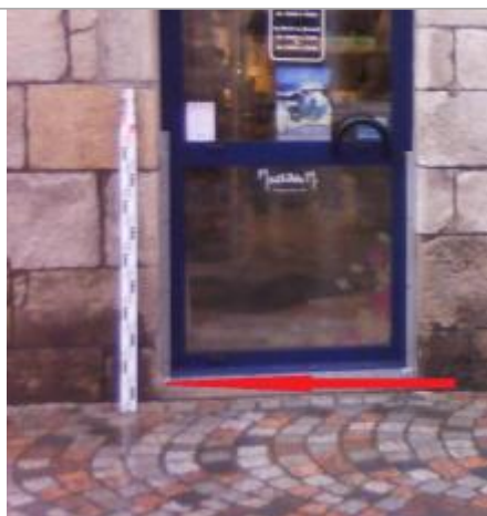
trottoir coté gauche (charnières) de la porte d'entrée du magasin

Altitude calculée de l'eau (en m) : 3.99