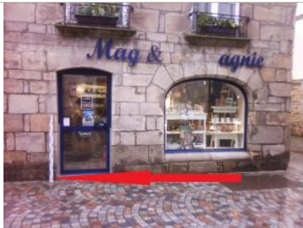
vue générale du site - magasin au n°20 rue René Madec