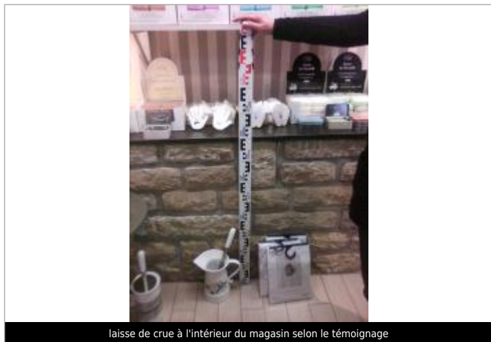
laisse de crue à l'intérieur du magasin selon le témoignage

Altitude calculée de l'eau (en m) : 4.32