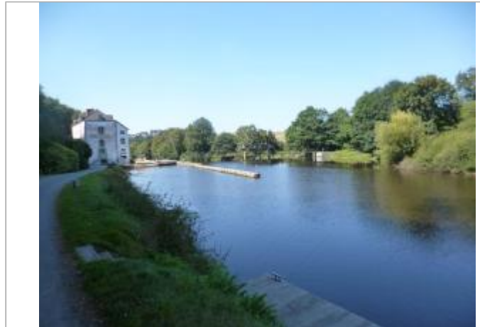
Moulin du Roch et église du Roch