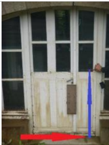
Laisse de crue sur la porte au niveau du crayon

Altitude calculée de l'eau (en m) : 9.69 m