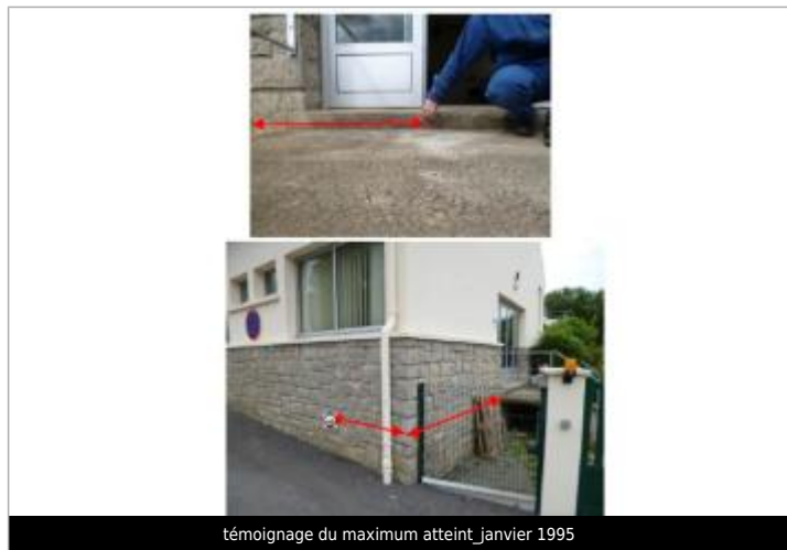
témoignage du maximum atteint janvier 1995

Altitude calculée de l'eau (en m) : 57.23 m