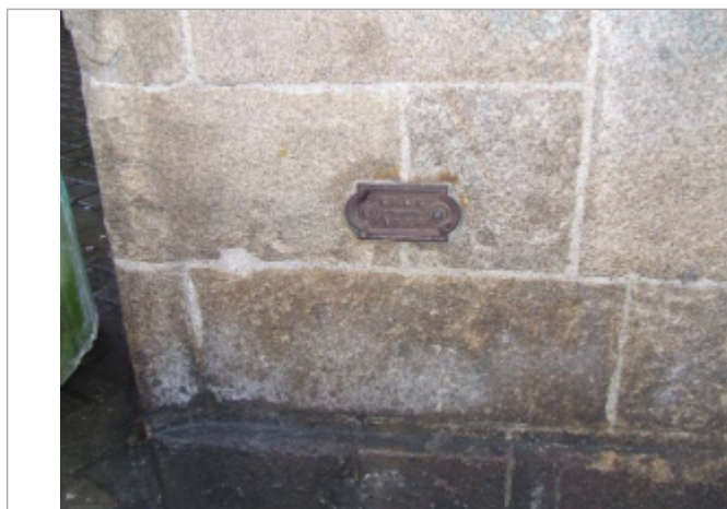
Allée Thurot / Place du Commerce