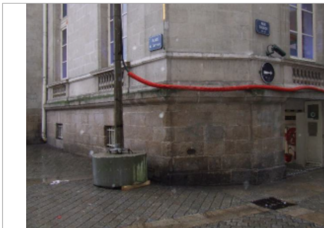
Palais de la Bourse